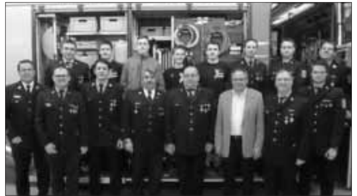
Hintere Reihe, von links: