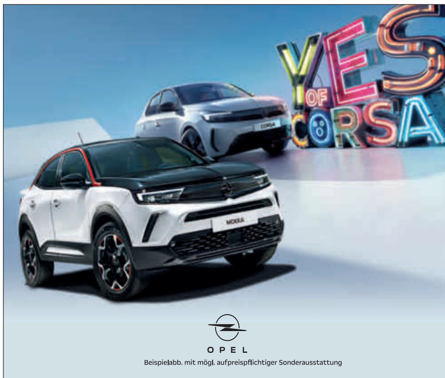
Beispielabb. mit mögl. aufpreispflichtiger Sonderausstattung

Königsbrunn Haunstetter Str. 57 Tel. (08231) 86033