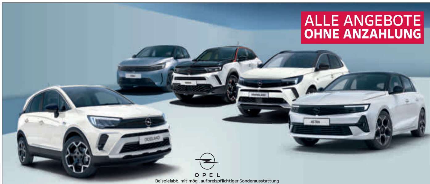
Beispielabb. mit mögl. aufpreispflichtiger Sonderausstattung

BIG DEAL 6 Jahre Garantie 1) 3 Inspektionen 2) GESCHENKT!