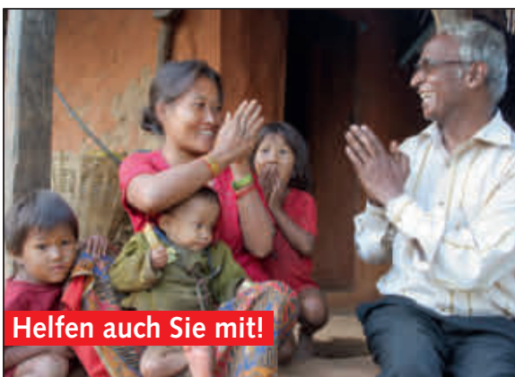
Helpen auch Sie mit!