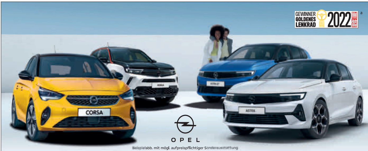
Beispielabb. mit mögl. aufpreispflichtiger Sonderausstattung