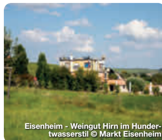
Eisenheim - Weingut Hirn im Hundertwasserstil