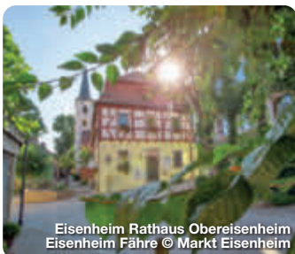
Eisenheim Rathaus Obereisenheim Eisenheim Fähre

Wer an der Mainschleife Zeit verbringt, der sollte unbedingt einen Abstecher in den Markt Eisenheim machen, genauer gesagt, in die beiden Dörfer Ober- und Untereisenheim. Wie zwei Perlen, aufgereiht an der Schnur des Maines, liegen die malerischen Dörfer am Beginn der Mainschleife. Geprägt wird die Gemeinde durch den Wein- und Obstanbau. 60 Winzerfamilien bewirtschaften im Voll- bzw. Nebenerwerb über 230 Hektar Weinberge. Auch sonst haben die beiden Orte einiges zu bieten. Ob im Tal direkt am Fluss oder in den Weinbergen rings um Eisenheim: Wanderer, Radfahrer, Wasserfreunde und Naturliebhaber finden hier paradisiische Zustände vor. TreffpunktDeutschland.de/eisenheim