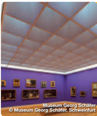
Museum Georg Schäfer