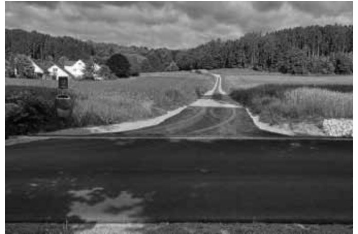
Ortsrand Dinkelscherben: Aufnahmefähige Rinne eingebaut

Auch an Stellen, wo bei vergangenen Starkregenereignissen Probleme deutlich wurden, sind Maßnahmen in Planung oder - im kleineren Umfang - auch schon umgesetzt.