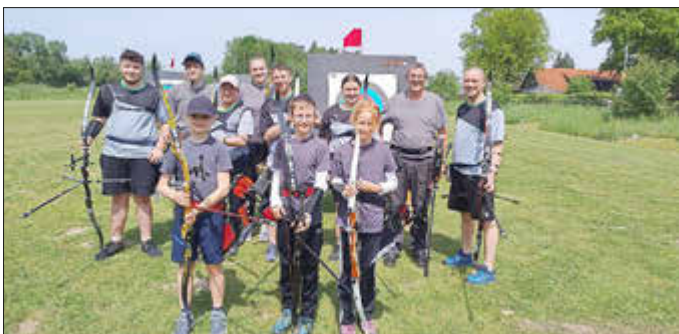
BSC Lindach, Systemschützen am Samstag

Bereits 3 Wochen zuvor fanden sich die Bogensportler im Gau Augsburg zur Meisterschaft 3D ein. Auch hier konnten die Lindacher 10 Starter anmelden und mit 3 Goldmedaillen, 2 Silber- und 2 Bronzemedaillen durchaus zufrieden sein.