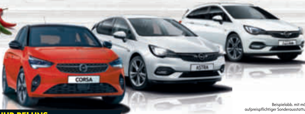
Beispielabb. mit mögl. aufpreispflichtiger Sonderausstattung