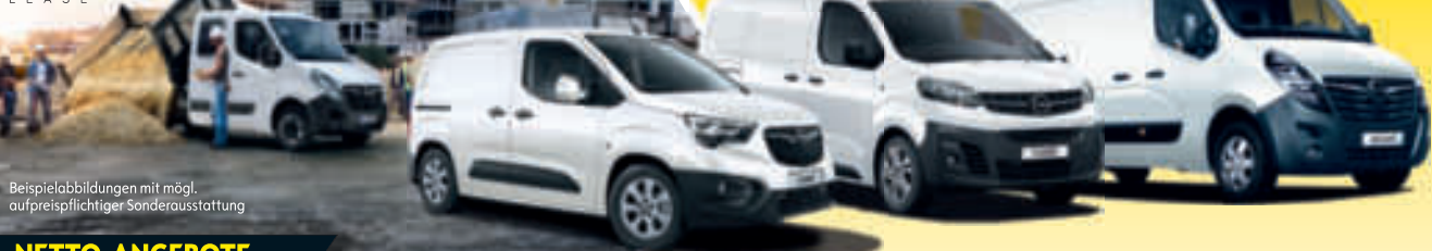
Beispielabbildungen mit mögl. aufpreispflichtiger Sonderausstattung

ANGEBOTE NUR FÜR GEWERBETREIBENDE ALLE ANGEBOTE ZZGL. GÜLTIGER, GESETZLICHER MEHRWERTSTEUER