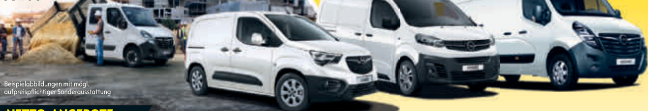
Beispielabbildungen mit mögl. aufpreispflichtiger Sonderausstattung

ANGEBOTE NUR FÜR GEWERBETREIBENDE ALLE ANGEBOTE ZZGL. GÜLTIGER, GESETZLICHER MEHRWERTSTEUER