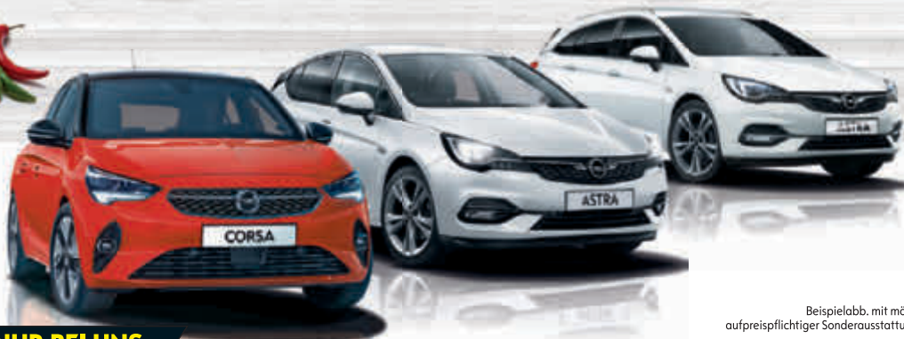
Beispielabb. mit mögl. aufpreispflichtiger Sonderausstattung