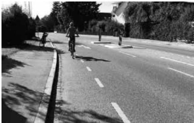
Beispiel: Kaufbeuren im August 2020