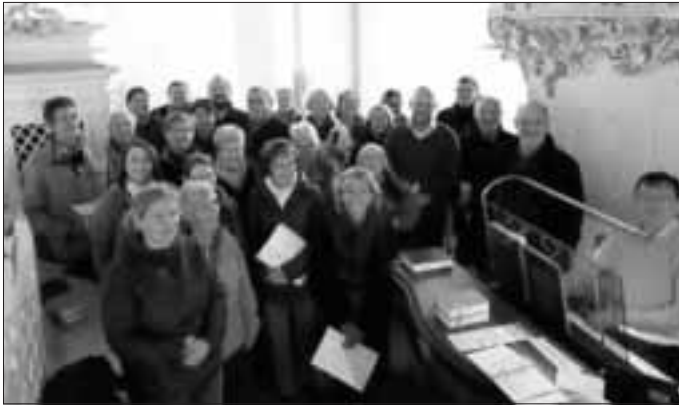
Die Sangerinnen und Sanger des Dinkelscherbener Kirchenchores auf der Empore der Wieskirche