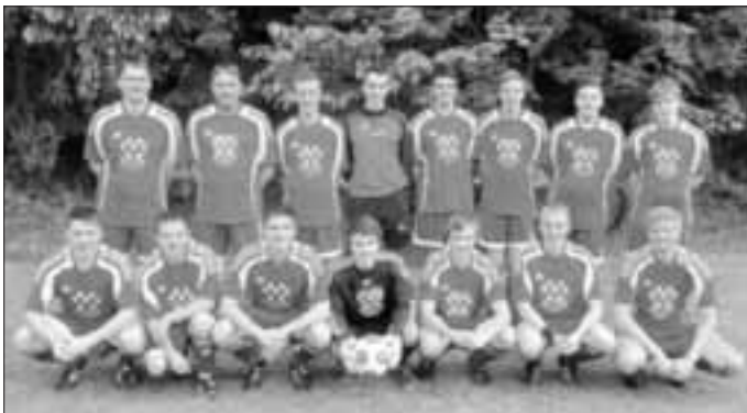
Die Mannschaft des SVO

Am Samstagnachmittag den 17.05. trat der SVO zu einem schweren Auswärtsspiel auf dem Sportplatz des Schullandheims Dinkelscherben gegen die Königsbrunner Freizeitkicker, die dort im Trainingslager waren, an.