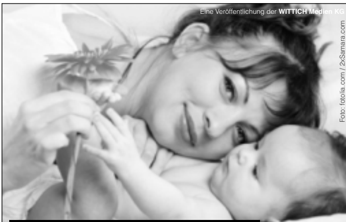
Eine Veröffentlichung der WITTICH Medien KG

Lokal informiert. Druck. Internet. Mobil.