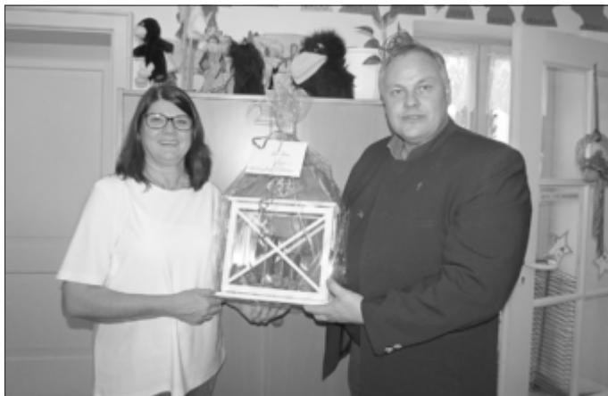
Das Kindergarten-Team von St. Ulrich