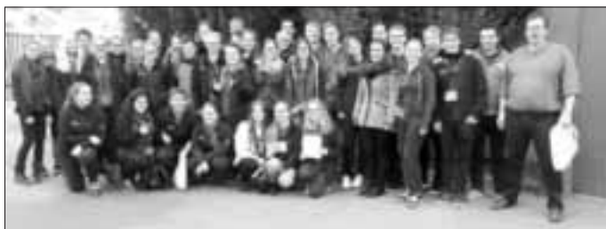
Das Jugendorchester der Musikvereinigung nach der Übergabe des Preises.

Nach dem Wettbewerbsauftritt am Samstagnachmittag wurde am Abend im Rahmen der Veranstaltung ausgiebig gefeiert. Zunächst präsentierte die Big Band der Bundeswehr ihr Konzertprogramm unter anderem mit atemberaubenden solistischen Beiträgen der Profi-Musiker. Die knapp 25 Musiker bestätigten eindeutig ihren Ruf als wohl beste Big Band Deutschlands. Anschließend hieß es dann: „It's partytime“. Dabei legte ein DJ moderne Rhythmen auf, zu welchen drei Musiker der Big Band mit Saxophon, Trompete und Posaune live improvisierten. Im Anschluss an die Party wurde mit den anderen Musikern des Wettbewerbs in einer Turnhalle übernachtet.