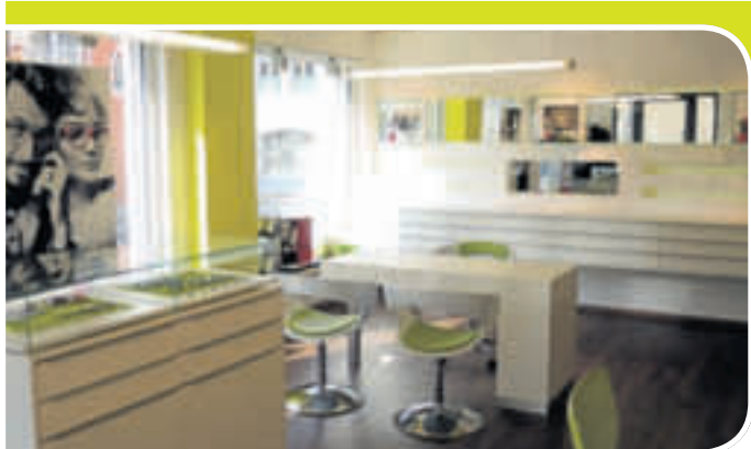
Die neuen Räume strahlen in einem freundlichen und hellen Licht und bieten viel Platz für die Gespräche mit den Kunden.