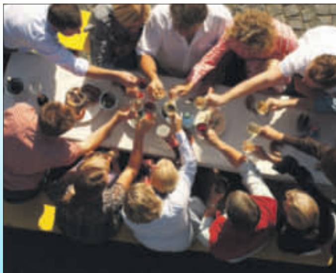
Herrlich: Die wärmenden Strahlen der Frühlingssonne bieten die perfekte Umgebung für ein gelungenes Osterbrunch im Restaurant mit der Familie und Freunden.

Einen Platz bekommt hier natürlich nur, wer früh genug reserviert.