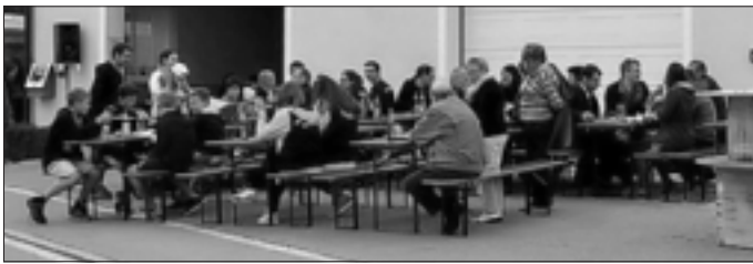
Lindacher Dorffest am Feuerwehrhaus