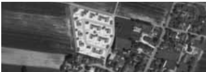
Entwurfsvariante des geplanten Baugebiets in Ettelried

Gelegenheit zur Information und zur Diskussion über Neubaugebiet, Friedhofsmauer, Bushaltestelle und Spielplatz gibt es heute, am 13. Juli 2017 im Schützenheim in Ettelried für alle Bürgerinnen und Bürger des Ortsteils.