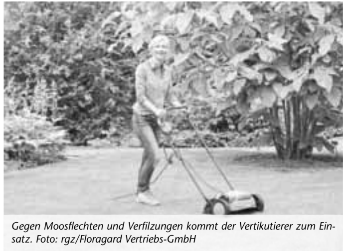
Gegen Moosflechten und Verfilzungen kommt der Vertikutierer zum Einsatz.

Hat sich der Rasen vom Vertikutieren erholt, wird es Zeit, ihn mit Sand, Humus, Nährstoffen und natürlichen Bodenorganismen zu versorgen. Das lässt sich heute beispielsweise mit RasenFit von Floragard in einem einzigen Arbeitsgang erledigen. Der beste Zeitpunkt dafür sind regnerische Tage, denn mit dem Regenwasser sickern die Nährstoffe besonders gut in den Boden ein und können den Rasen so optimal versorgen. Erhältlich ist die Rasenpflege online oder in den Gartencentern der großen Baumärkte.