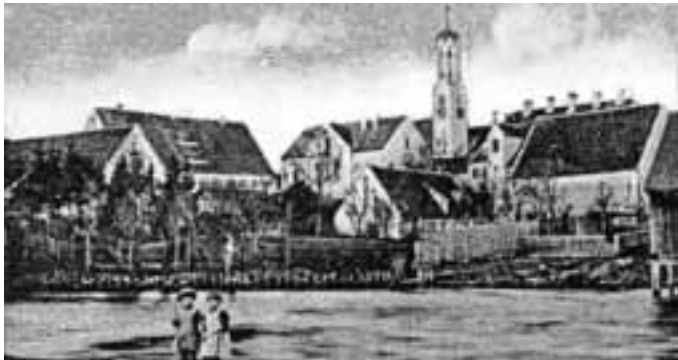
1902 - Zusam mit Vikari, Kirche und Rathaus

Ein Stapel Bildpostkarten mit alten Ortsansichten konnte kürzlich günstig erworben werden. Mit Hilfe der Bilder auf den Karten und dem Erscheinungsjahr können interessante Rückschlüsse auf die Ortsentwicklung von Dinkelscherben gezogen werden.