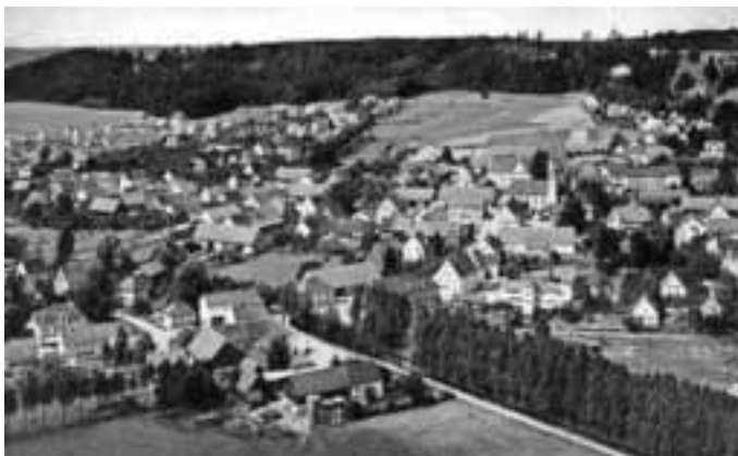
1962 - Noch kein Freibad und noch keine Ustersbacher Straße

In Kombination mit Gemeinderatsprotokollen aus der jeweiligen Zeit wird die Geschichte eines Ortes lebendig und verständlich. So kann zum Beispiel das Alter und die Entstehungsgeschichte von Straßen, Gebäuden, Wohngebieten oder Gewerbeflächen ermittelt werden.