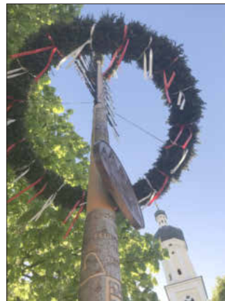
Das Aufstellen von Maibäumen gehört auch in Bayerisch-Schwaben zu den wichtigsten Bräuchen im Jahreslauf.