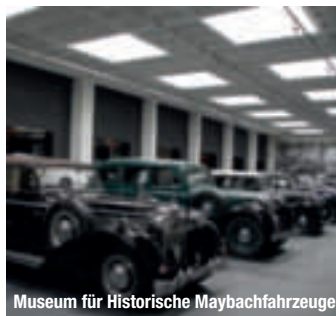
Museum für Historische Maybachfahrzeuge

Fränkische Dreiflüssestadt – so kennen die meisten Gemündenen. Sinn und Fränkische Saale münden hier in den Main. Im Stadtteil Wernfeld fließt noch ein vierter Fluss – die Wern – in den Main, so dass auch von der Vierflüssestadt gesprochen wird. treffpunktdeutschland.de/gemuenden