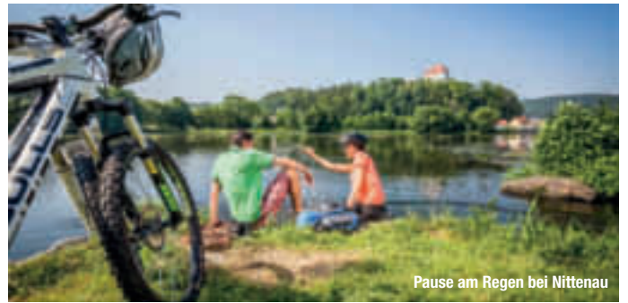
Pause am Regen bei Nittenau