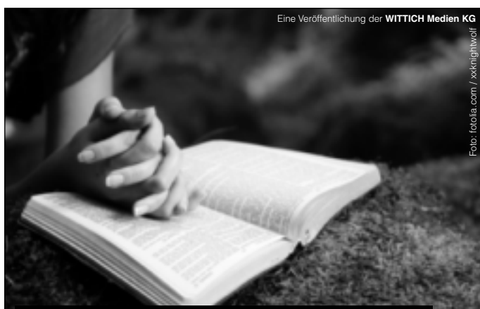
Eine Veröffentlichung der WITTICH Medien KG