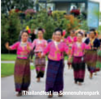
Thailandfest im Sonnenuhrenpark