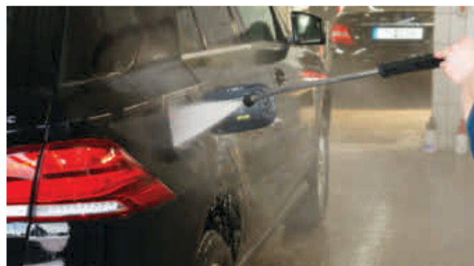
Durch eine häufige Behandlung in der Waschanlage wird der Autolack an der Oberfläche empfindlicher, denn es kommt eine Waschlauge zum Einsatz, die entfettend wirkt.

lung in der Waschanlage wird der Fahrzeuglack an der Oberfläche empfindlicher, da dort mit einer Waschlauge gewaschen wird, die entfettend wirkt. „Die jährliche Fahrzeugaufbereitung ist deshalb sinnvoller als eine zu oft durchgeführte Fahrzeugwäsche“, erklärt Markus Herrmann. Wer sein Auto zu oft wasche, entferne den ursprünglichen Lackschutz, ohne es zu merken.