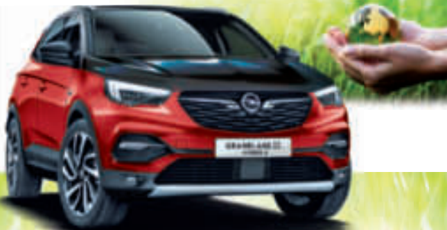
Beispielabbildung mit mögl. aufpreispflichtiger Sonderausstattung