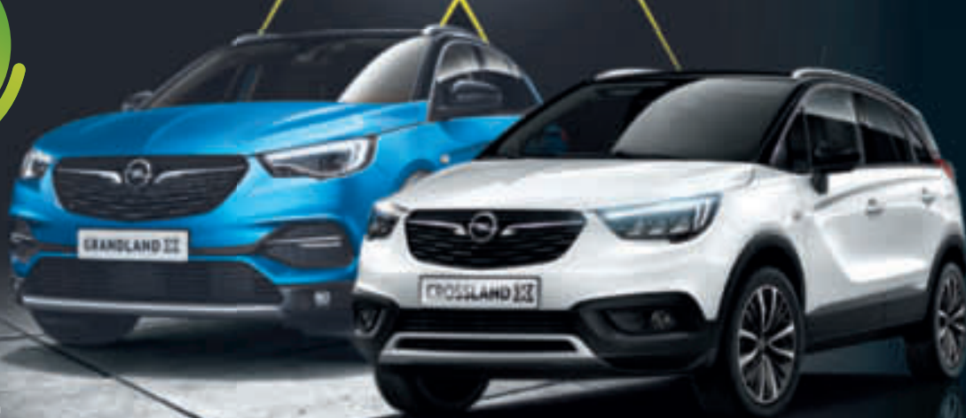
Beispielabbildungen mit mögl. aufpreispflichtiger Sonderausstattung