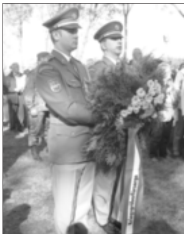
Totenehrung auf einem Soldatenfriedhof

Wie in jedem Jahr zeigten sich die Oberschöneberger bei der Haussammlung für den Volksbund Deutsche Kriegsgräberfürsorge e.V. wieder sehr vergangenheitsbewusst. Die ehrenamtlichen Sammler konnten für das Motto „Versöhnung über den Gräbern - Arbeit für den Frieden“ einen Betrag von 992,90 Euro einsammeln. Den Sammlern/Sammlerinnen für ihre Mühe herzlichen Dank. Allen Spendern wollen wir ganz besonders für die großzügige Spende danken.