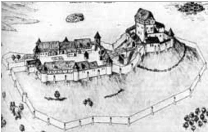
Rekonstruktionszeichnung der Burg Zusameck