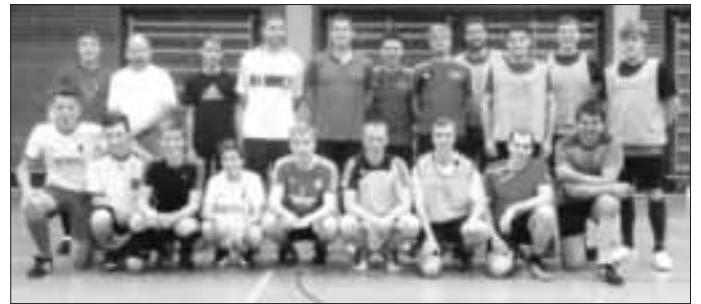
(Die Fußballer vom SVO beim Trainingsauftakt)

Wer kommenden Sonntag die Nase vorne hat, bleibt abzuwarten, denn da werden die Teams und somit die Karten neu gemischt.