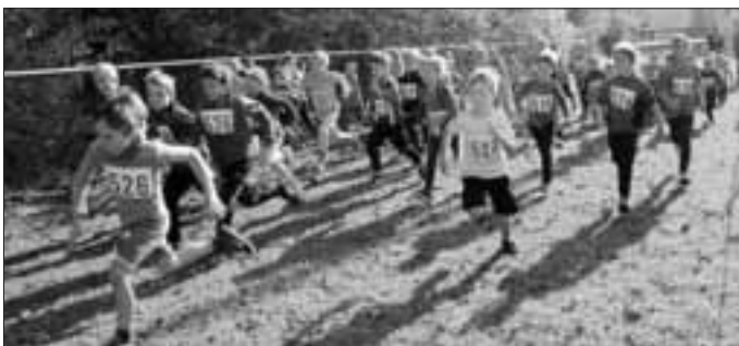
Bambinis beim Start

Die 160 Schüler und Jugendlichen dominierten bei bestem Laufwetter den 37. Crosslauf in Dinkelscherben. 64 Bambinis rannten auf 500 Metern ihren Preisen entgegen. Beinahe 70 Jedermannsläufer waren zur Team-Wertung angetreten und 30 Leistungssportler stellten sich auf der anspruchsvollen Laufstrecke der Konkurrenz.