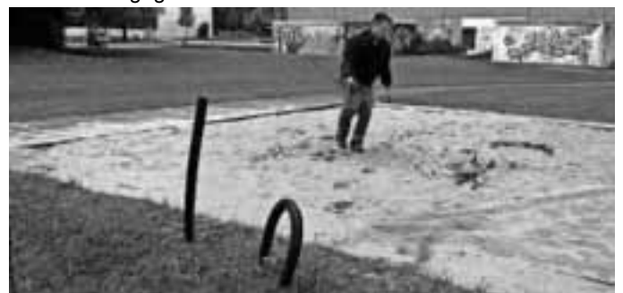
Edgar Kalb, 1. Bürgermeister

Immer wieder ärgern sich die Hausmeister über blinde Zerstörungswut auf dem Schulgelände. Zuletzt haben „starke Typen“ die Umrandung der Weitsprunganlage heraus gerissen und ins Erdreich gedrückt. Gerne nehmen wir sachdienliche Hinweise entgegen und leiten sie an die Polizei weiter!