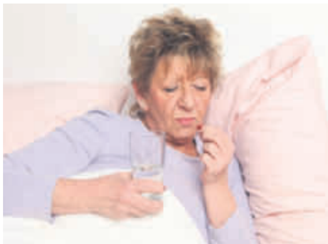
Hände weg vom starken Schlafmittel, wenn nervöse innere Unruhe die Nachtruhe raubt. Sie führen schnell in die Abhängigkeit, betäuben lediglich und bekämpfen die eigentliche Ursache der Schlafstörung nicht: die nervöse innere Unruhe