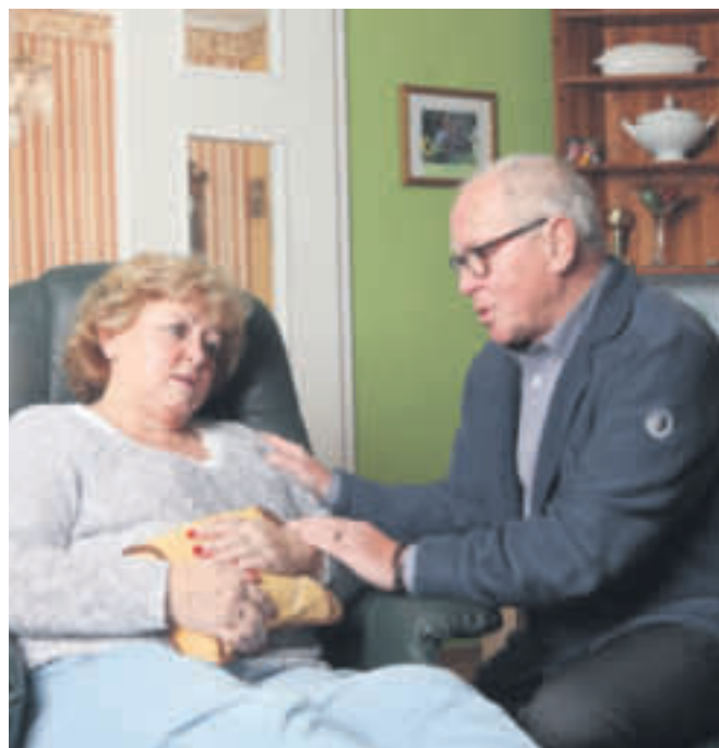
Kennen Sie das – diese Bauch- und Magenbeschwerden, Blähungen, leichte Übelkeit und das unangenehme Völlegefühl nach dem Essen

Für den Akutfall oder häufig wiederkehrende Beschwerden steht Gasteo® (20ml 7,85 Euro, Apotheke, PZN 1073 8439) heute schon in vielen Haus-Apotheken.