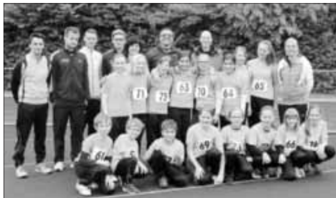
Die Jugend und Schülerinnen/Schüler mit Betreuern

3. Mai: für gute Leistungen war es bei 6° C einfach zu kalt. Dennoch haben 21 Leichtathletinnen und Leichtathleten den Weg zur Bahneröffnung nach Königsbrunn gefunden, für sie war es erster Test auf der Bahn.